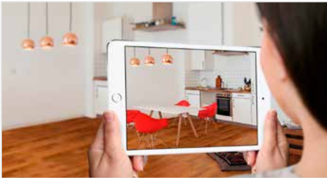
Per Klick werden die Produkte in Echtzeit im Raum visualisiert. Dies schafft Vertrauen und beschleunigt die Kaufentscheidung.