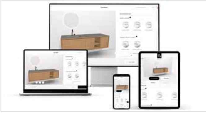
Mit dem Produkt-Konfigurator setzen Sie auf eine deutlich gesteigerte Kundeninteraktion und erhöhte Kaufbereitschaft durch maßgeschneiderte Produkte.