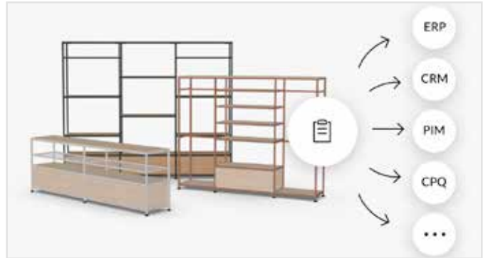
Integrieren Sie den Konfigurator nahtlos in Ihre Vertriebskanäle – für einen effizienten Workflow und optimale Kundenkommunikation.