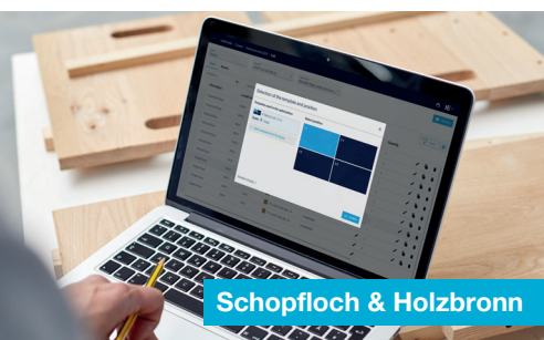
Schopfloch & Holzbronn