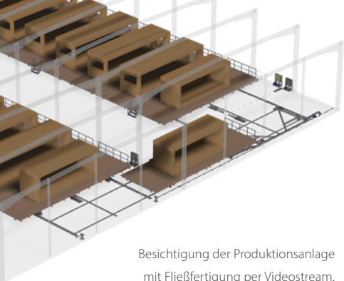
Besichtigung der Produktionsanlage mit Fließfertigung per Videostream.